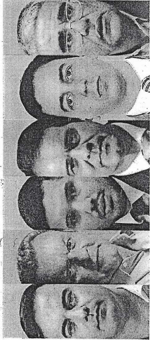
PRIMEIRA pesquisa Datafolha para Prefeitura de Fortaleza foi divulgada nesta quinta, 27

IAVALIAÇÃO | Tanto Capitão Wagner como José Sarto, André Fernandes, Evandro Leitão, Célio Studart e Eduardo Girão destacaram positivamente os números